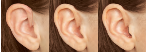
Tamaño ultrapequeño BTE (detrás de la oreja)